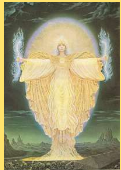
De bovenstaande plaat van de schilder Johfra heeft als titel Zoon der slangen. De beschrijving bij dit kunstwerk luidt:

"Hij heeft zichzelf, levende, tot een graf gemaakt'.