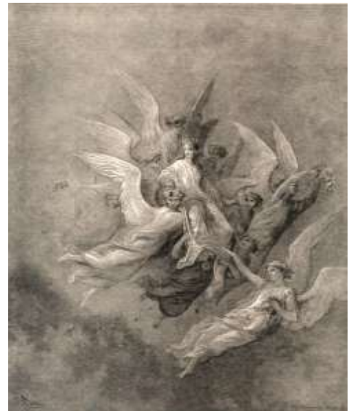
Beatrice enthroned in her place in the celestial rose

Uit: Gnosis, de kennis van het hart / Marcel Messing