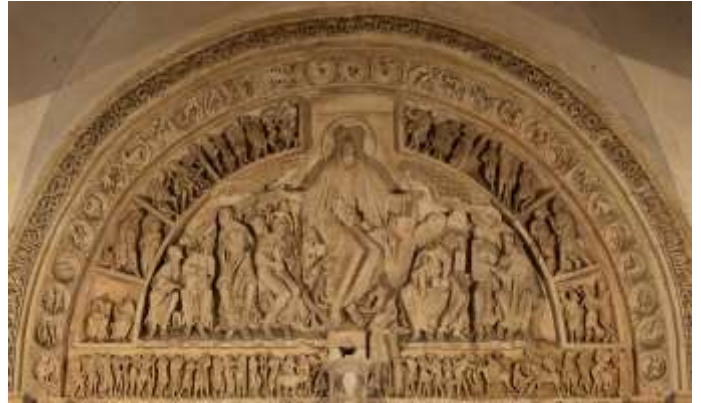
basiliek Vézelay, Christus Majestueus